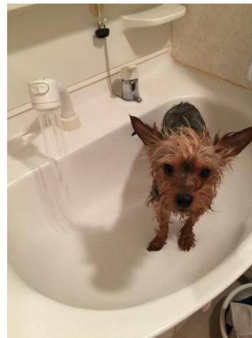
洗面台でシャンプーは一苦勞

当社は、セミナーをきっかけに、当社がおこなう顧客に寄り添った家づくりの理解も深めていきます。